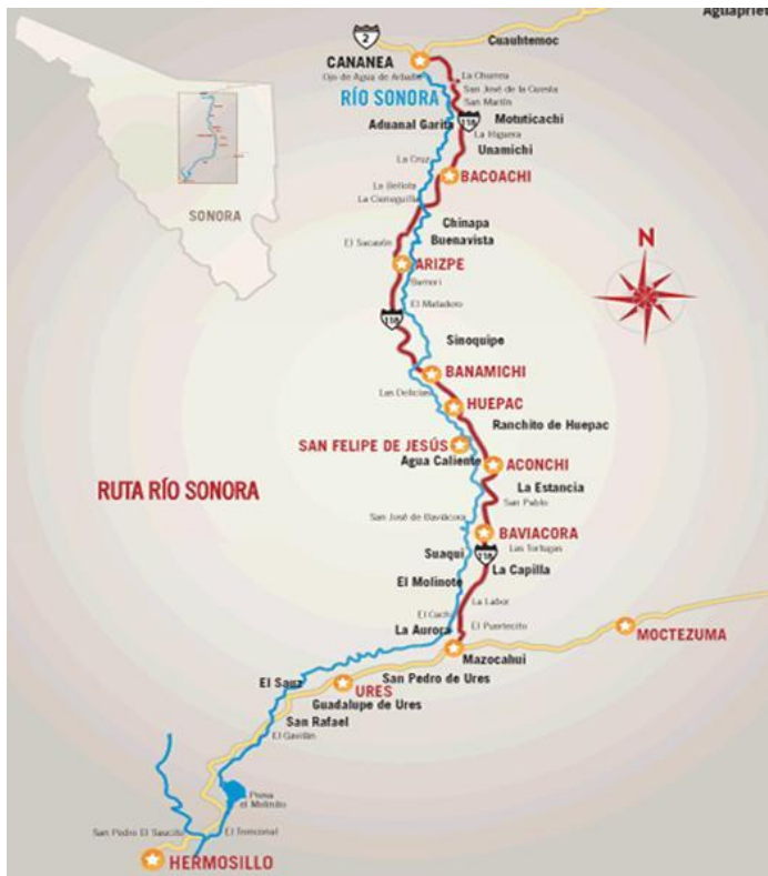
Mapa 3. Ruta de los pueblos contaminados