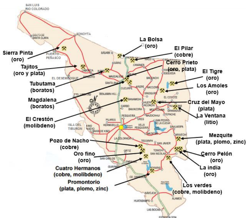
Mapa 2. Proyectos en exploración